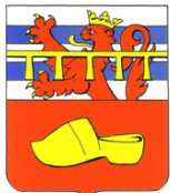
Commune de Nassogne