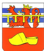
Commune de Nassogne