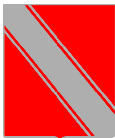
Commune de Gedinne

Les lots non attribués lors de cette vente seront remis en vente par soumissions sans autre forme de publicité le Wednesday 15 May.