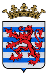
Ville de Durbuy

Durbuy Cne, Hotton Cne, Marche En Famenne Cne