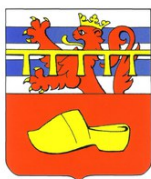
Commune de Nassogne

Les lots non attribués lors de cette vente seront remis en vente par soumissions sans autre forme de publicité le Monday 23 November.