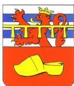
Commune de Nassogne